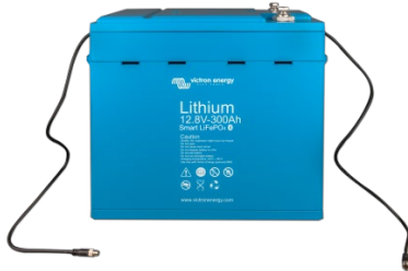
Batterie LiFePO4 12,8 V 300 Ah

Fonction très utile pour localiser un (éventuel) problème, comme un déséquilibre sur les cellules par exemple.