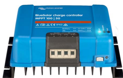
Contrôleur de charge solaire MPPT 100/50